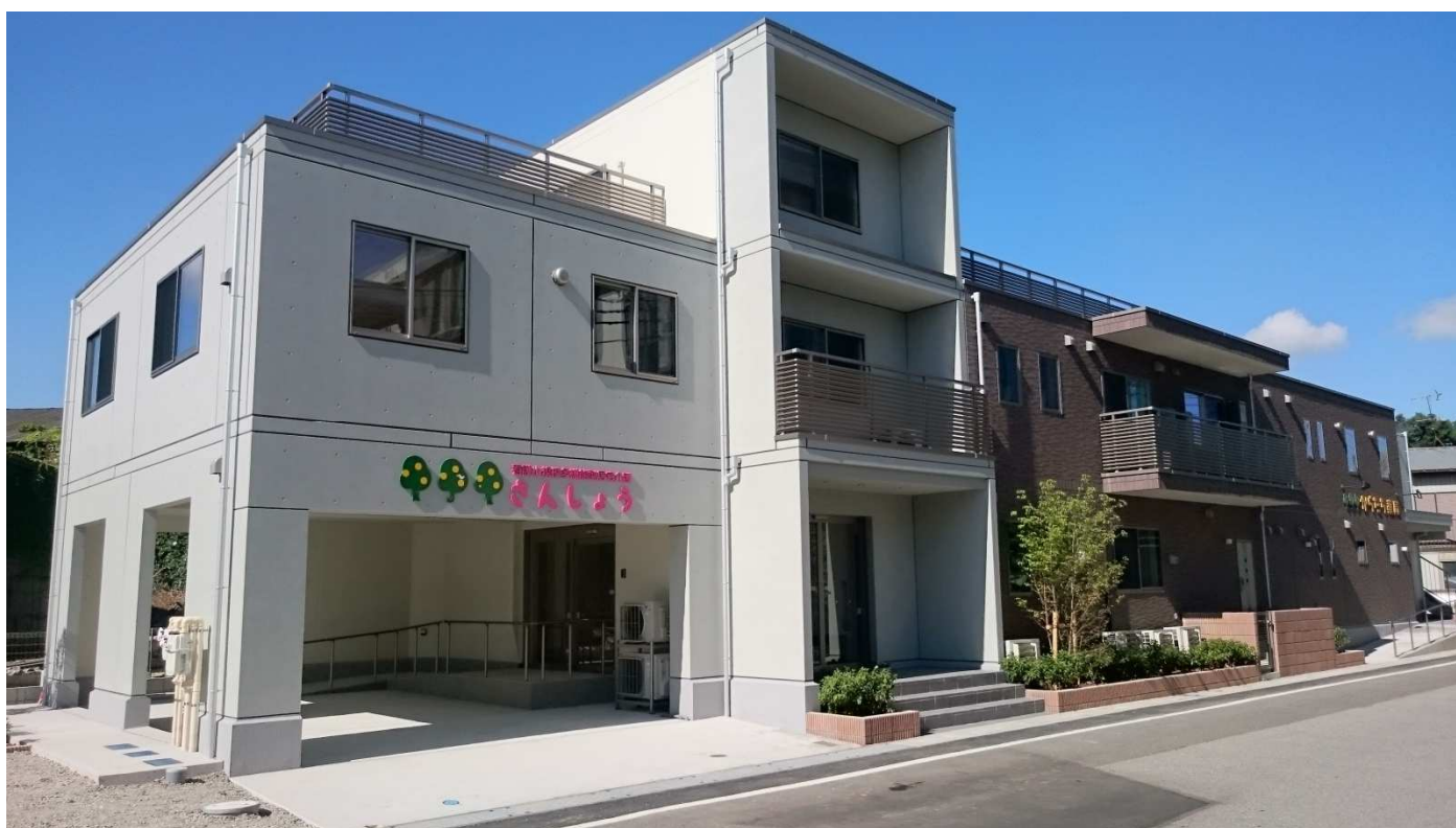
完成した幸樹会館（松戸市河原塚4-1-1）

また、からたち薬局・介護ショップからたちは、9月5日から幸樹会館で業務を開始します。今後とも、皆様のご理解・ご協力をよろしくお願いいたします。