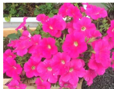
日日草（記事は4面に）

一般皆様の内覧会を8月30日に行いますので、ぜひご参加ください。どなたでもご覧いただけます。当日は、「第4回地域交流カフェ」を兼ねて行います。