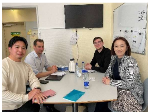
Hvidovre Hospitalの薬剤師へのインタビュー

デンマークが幸福度ランキング1位といわれる理由の一つとして「ヒュッゲ」というデンマークの人々の生活スタイルがあります。仲のいい人、家族と部屋の中で居心地の良い雰囲気を作ってくつろぐことを意味します。デンマークでは、定時の16時には仕事を終え（金曜は15時）、大切な人、家族との時間を大切にしています。家事も共同で行う夫婦が多く、16時過ぎると道路は自転車であふれスーパーには男性の姿も多くみられました。