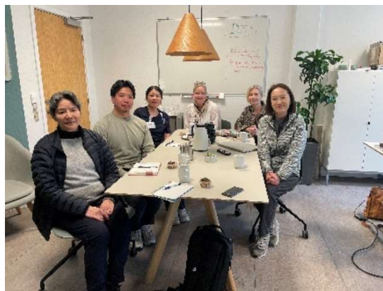
Center for Rehabilitering og akutpleje Københavnの 看護師と施設長へのインタビュー