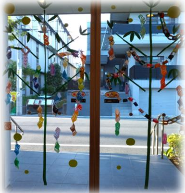
←1F正面の自動ドアの飾り