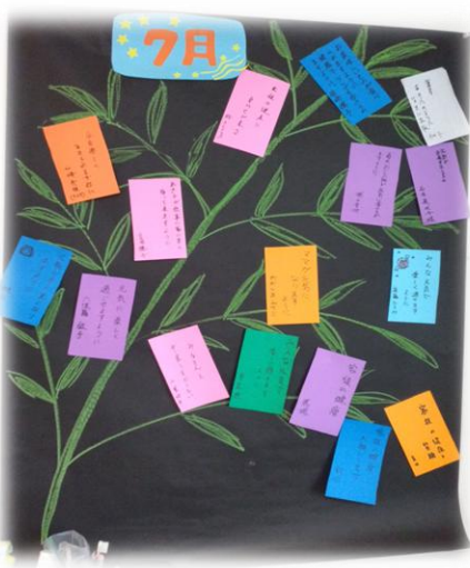
さんしょうの七夕飾り→

そのあとは七夕をイメージしたおやつを食べるなど、季節感を味わっていただきました。