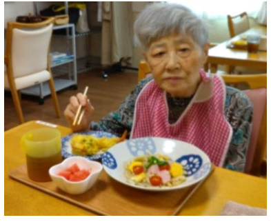
↑7月7日の昼食は七夕うどん↑